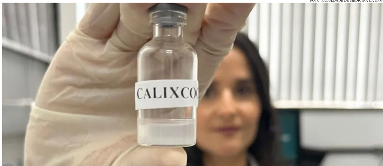
A BUSCA POR NOVAS FORMAS DE TRATAMENTO CONTRA A DEPENDÊNCIA QUÍMICA TEM MOBILIZADO PESQUISADORES EM TODO O MUNDO

A Calixcoca foi desenvolvida para estimular o sistema imunológico a produzir anticorpos específicos contra as moléculas da cocaína. Esses anticorpos passam a circular pelo organismo e, ao identificar