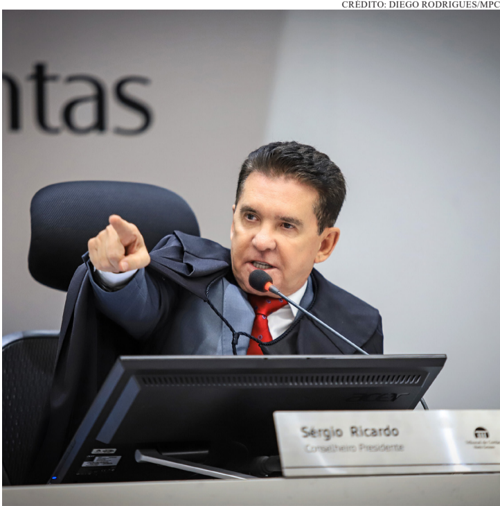
A INICIATIVA SURTIU A PARTIR DE UMA MESA TÉCNICA CONDUZIDA PELO PRÓPRIO TCE-MT