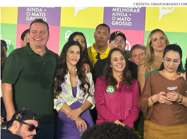
A SOLENIDADE CONTOU COM A PRESENÇA DA PRESIDENTE NACIONAL DA SIGLA

Durante o evento também foi registrado um expressivo movimento de filiações. Ao