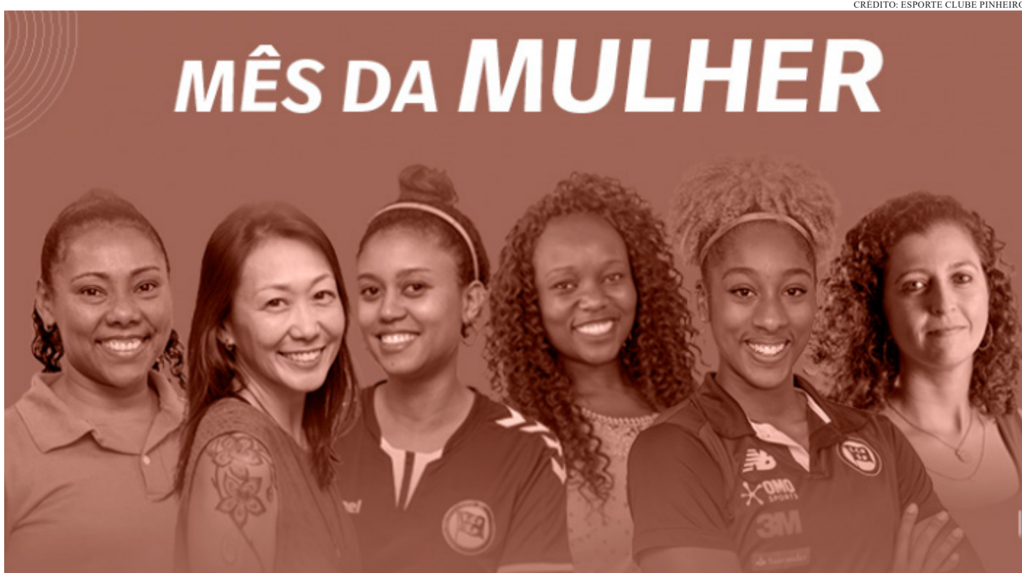
ESSAS CONQUISTAS, NO ENTANTO, CONVIVEM COM DESAFIOS PERSISTENTES, COMO A VIOLÊNCIA DE GÊNERO

No início do século XX, a mobilização política se intensificou. Em 1910, foi criado o Partido Republicano Feminino, que defendia o direito ao voto. A conquista veio em 1932, quando o sufrágio feminino foi reconhecido no Brasil. No ano seguinte, Carlota Pereira de Queirós tornou-se a primeira deputada federal brasileira. Outras mudanças importantes ocorreram nas décadas seguintes. Em 1962, o Estatuto da Mulher Casada permitiu que mulheres trabalhassem sem autorização do marido. Em 1977, o divórcio foi legalizado no país. Já em 1979, foi revogada a proibição que impedia mulheres de praticar futebol no Brasil. A partir dos anos 1980, avanços institucionais também ganharam força. Em 1985, foi criada em São Paulo a primeira Delegacia de Atendimento Especializado à Mulher (DEAM), marco na política de enfrentamento à violência de gênero. Três