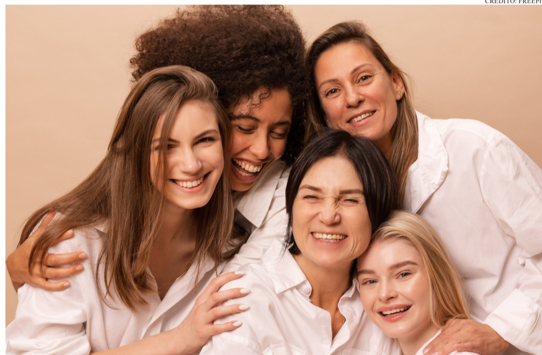
A PARTIR DOS ANOS 1980, AVANÇOS INSTITUCIONAIS TAMBÉM GANHARAM FORÇA