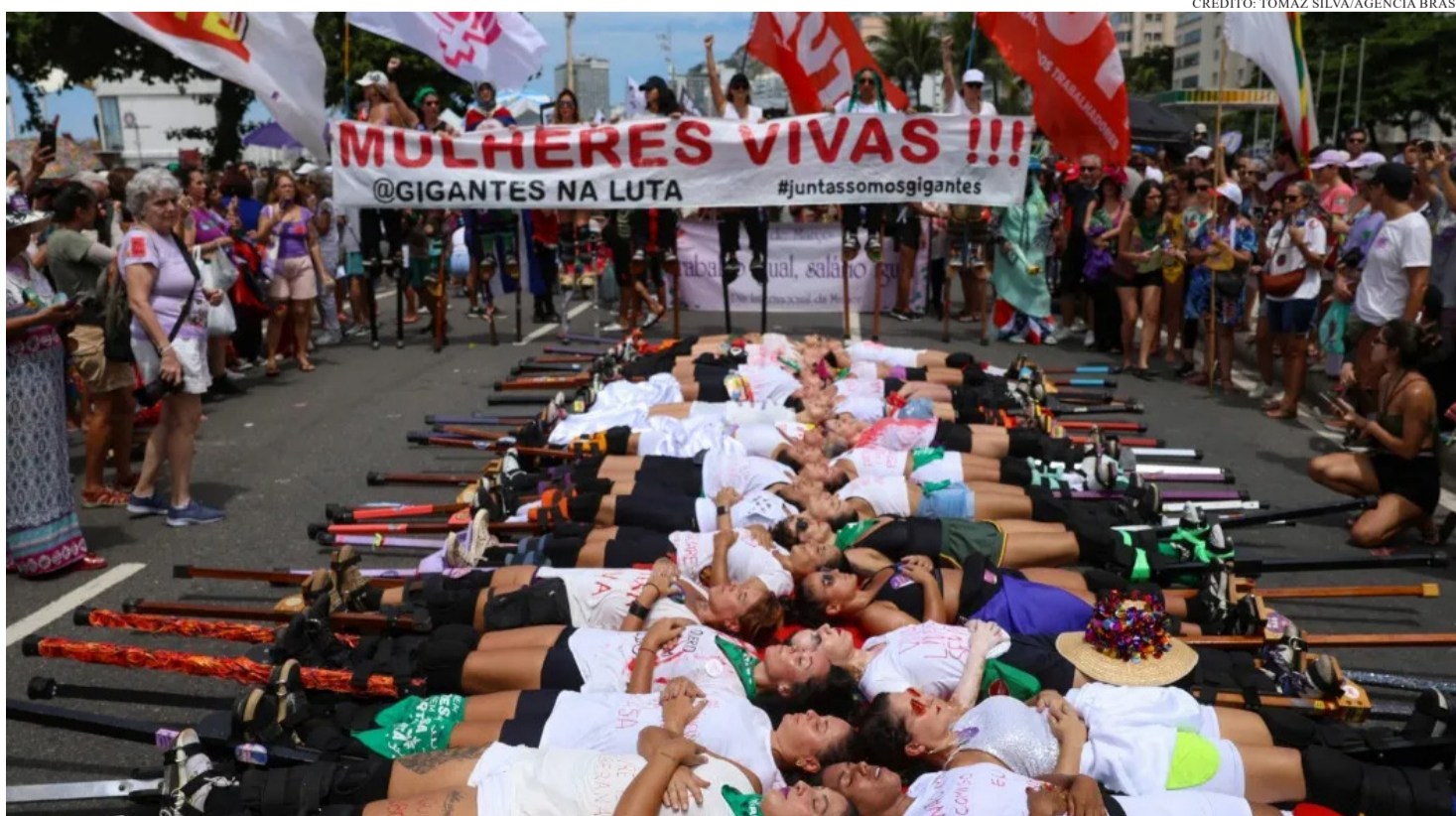
PROTESTOS CONTRA A VIOLÊNCIA DE GÊNERO VOLTAM ÀS RUAS NESTE 8 DE MARÇO DE 2026

*Por Cami Almeida sob supervisão de Gene Lannes