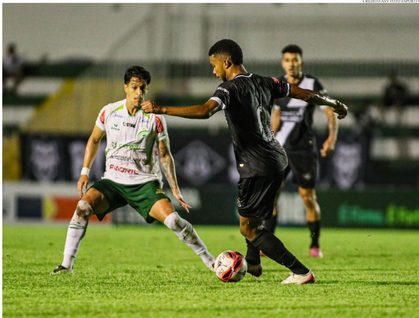
DEPOIS DE QUASE DUAS DÉCADAS DE ESPERA, O TIGRE DA VARGAS CONQUISTOU NOVAMENTE O CAMPEONATO MATO-GROSSENSE.

Nas cobranças, o Mixto mostrou eficiência e frieza para garantir a vitória e levantar o troféu estadual. A conquista encerra um jejum que durava desde 2008 e marca o retorno do clube às grandes decisões do futebol mato-grossense. O título também tem gosto especial porque a equipe voltou a disputar uma final depois de 13 anos. A última vez que o Alvinegro havia chegado